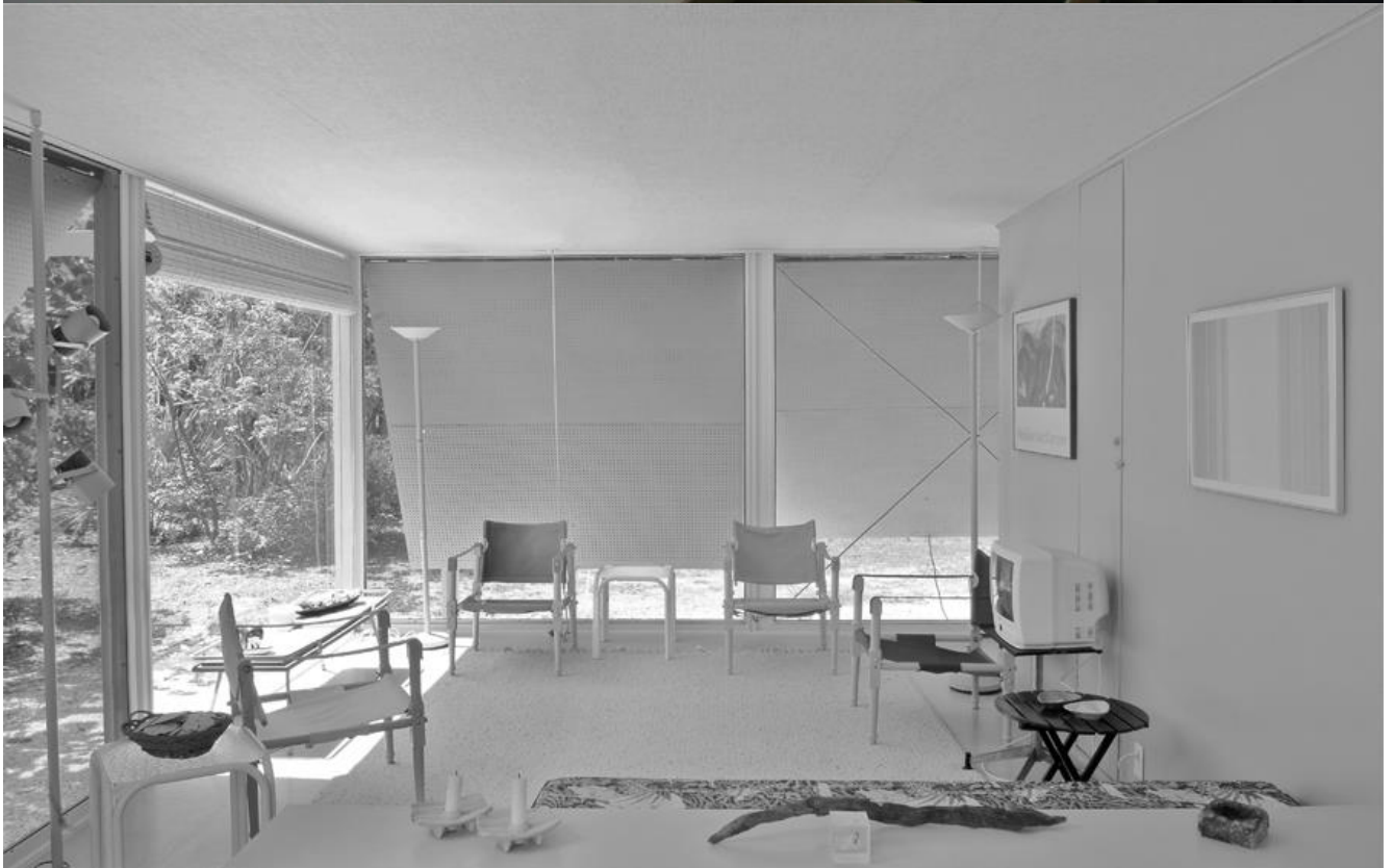
Libro "Casas Refugio" Editorial Gili, páginas 90 a 93.